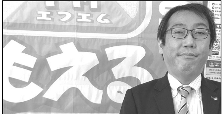
【4月2日】工藤公仁留萌振興局長「クロストーク769」に出演。令和5年度の抱負を語りました。